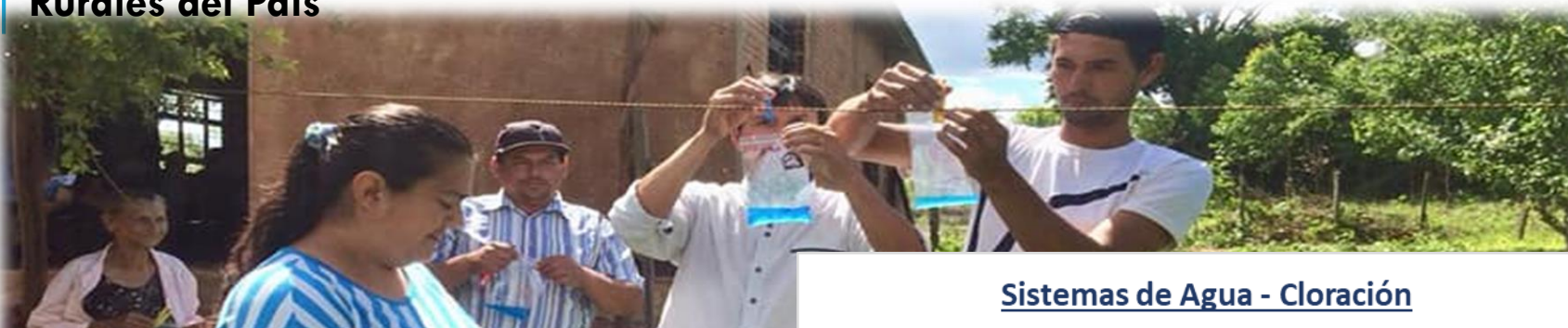
Sistemas de Agua - Cloración