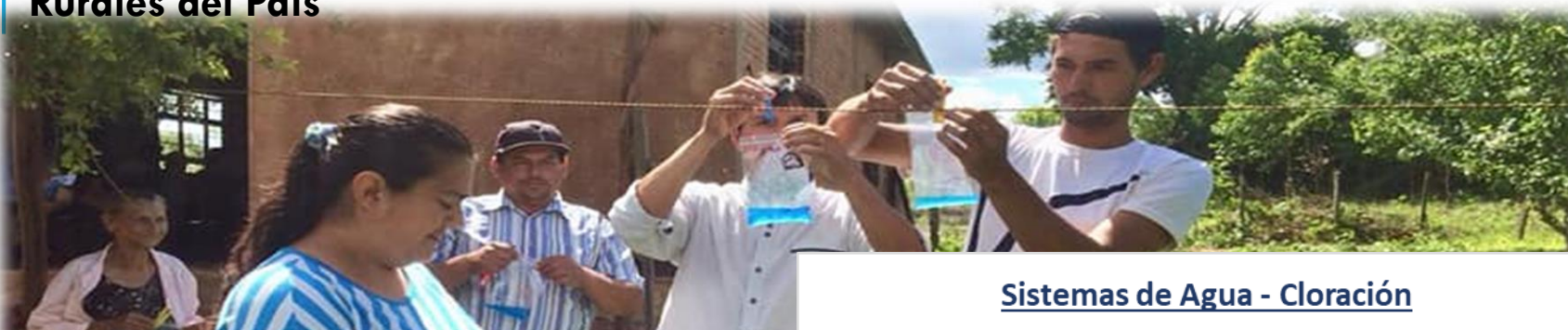
Sistemas de Agua - Cloración